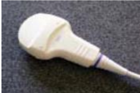
Afbeelding 1 Transducer voor afbeeldingen via de buikwand.